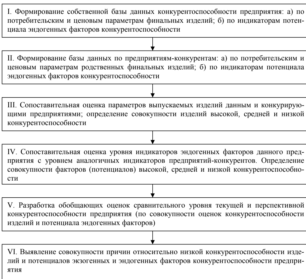
Рис. 1. Организационный алгоритм действий менеджмента по идентификации уровня конкурентоспособности предприятия

Функциональные стратегии развития бизнеса с позиций роста конкурентоспособности предприятия целесообразно рассматривать в двух аспек-